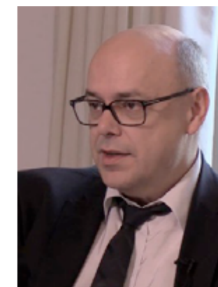
Pr Paul-Michel Mertes, Président du CFAR (CHRU Strasbourg)

En 2009, alors qu'en trois semaines, trois anesthésistes réanimateurs viennent de se suicider, le CFAR décide de créer la commission SMART (Santé des Médecins Anesthésistes Réanimateurs au Travail). Le SNIA, représentatif des Infirmières Anesthésistes, est associé à cette commission.